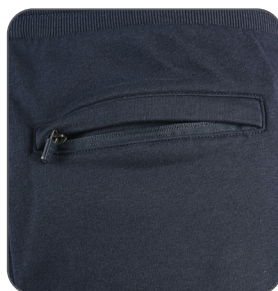
zadní kapsa zadné vrecko back pocket tylna kieszeń