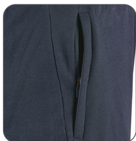
boční kapsa bočné vrecko side pocket boczna kieszeń